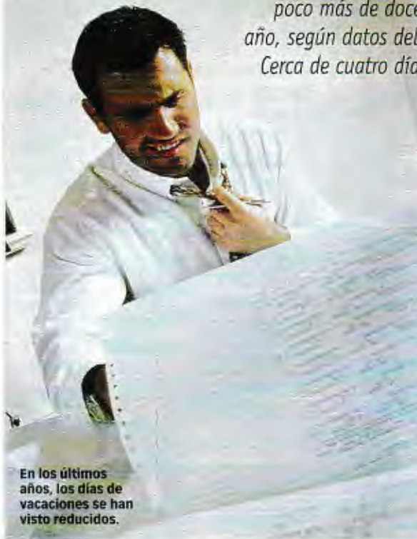
En los últimos años, los días de vacaciones se han visto reducidos.

Los españoles disfrutamos de media poco más de doce días de vacaciones al año, según datos del Ministerio de Trabajo. Cerca de cuatro días menos que en 1992.